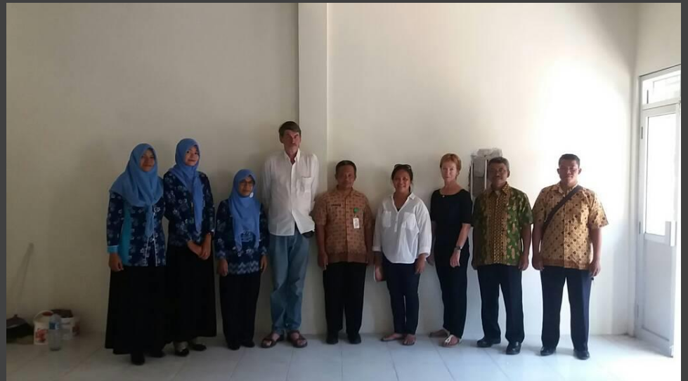
In de nieuwe klaslokaal